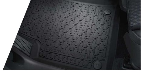
Celoročné podlahové rohože – čierne Číslo dielu: 13476012 Cenníková cena: 93,31 €