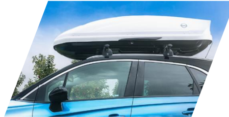
Strešný box Thule "Ocean 80,," Rozmery: 1 330 x 860 x 370 mm. Objem: 320 l Číslo dielu: 93165509 Cenníková cena: 289,37 €