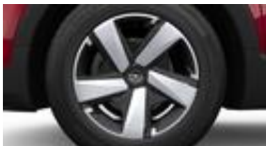
16" štruktúrované ocelové disky s strieborno-čiernym krytmi (ZHD1)