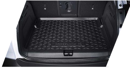
Gumová podložka do batožinového priestoru Číslo dielu: 39050915 Cenníková cena: 88,94 €