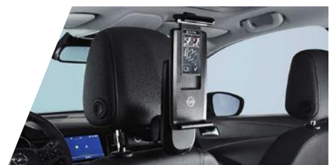
FlexConnect držiak tabletu (univerzálny) potrebne objednať FlexConnect adaptér Číslo dielu: 39092067 Cenníková cena: 231,23 €

Kompletnú ponuku príslušenstva nájdete na: OPEL PRÍSLUŠENSTVO