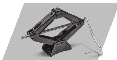
Súpravu náradia a zdvihák Číslo dielu: 1688296280 Cenníková cena: 50 €