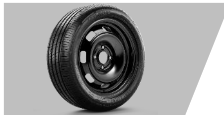
Rezervné dojazdové koleso 16" Súpravu náradia sa objednáva samostatne. Číslo dielu: 1677096680 Cenníková cena: 180 €