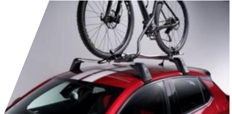
Strešný nosič bicykla Thule "Expert 298" Číslo dielu: 1642748780 Cenníková cena: 168,62 €