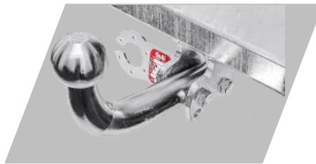
Ťažné zariadenie Galia Skrutkové prevedenie: 162€ Bajonetové prevedenie: 223,40 €