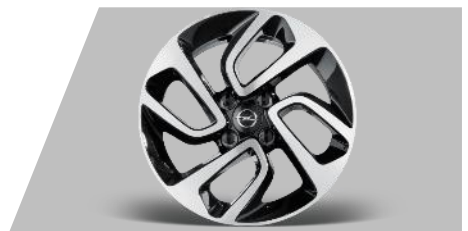
Disk z ľahkej zliatiny 16", 4 DVOJITÉ LÚČE Rozmery: 6,5Jx6 ET20, rozstup: 4x108 Pre pneumatiky: 205/60 R 16 92H Číslo dielu: 13469365 Cenníková cena: 194,98 €