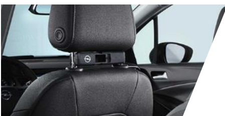
FlexConnect adaptér Číslo dielu: 13442005 Pôvodná cena: 59 €