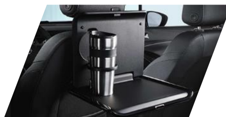
FlexConnect sklupný stolček potrebne objednať FlexConnect adaptér Číslo dielu: 13442006 Cenníková cena: 177,41 €