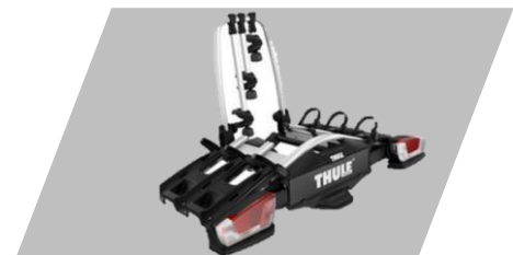
Nosič pre 3 bicykle na ťažné zariadenie "Coach 3 - 276" Číslo dielu: 9858801480 Cenníková cena: 1296,72 €