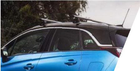
Základný nosič hliníkový Sada 2 tyčí. model so strešnými ližinami / bez strešných ližín Číslo dielu: 13474370 / 13474372 Cenníková cena: 342,23 € / 430,79 €