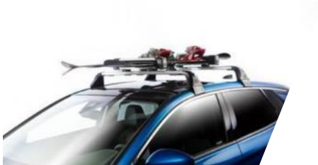
Nosič lyží/snowboardov Thule 7324, 4 páry lyží Číslo dielu: 9858802280 Cenníková cena: 323,62 € * v ponuke aj pre 6 párov